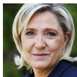
Marine le Pen